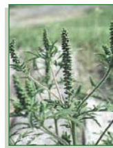
HERBE À POUX