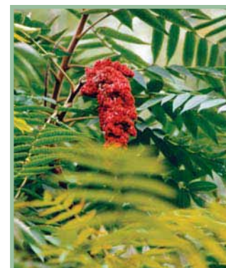
Sumac vinaigrier

L'inflammation de la peau est le résultat de la réponse immunitaire du corps humain aux cellules contaminées. La dermatite n'est donc pas transmise à un autre individu par le contact des plaies, sauf si l'urushiol est encore présent sur la surface de la peau. Un grand nombre d'animaux et d'oiseaux sont complètement insensibles, parce que leur système immunitaire est différent de celui des humains.